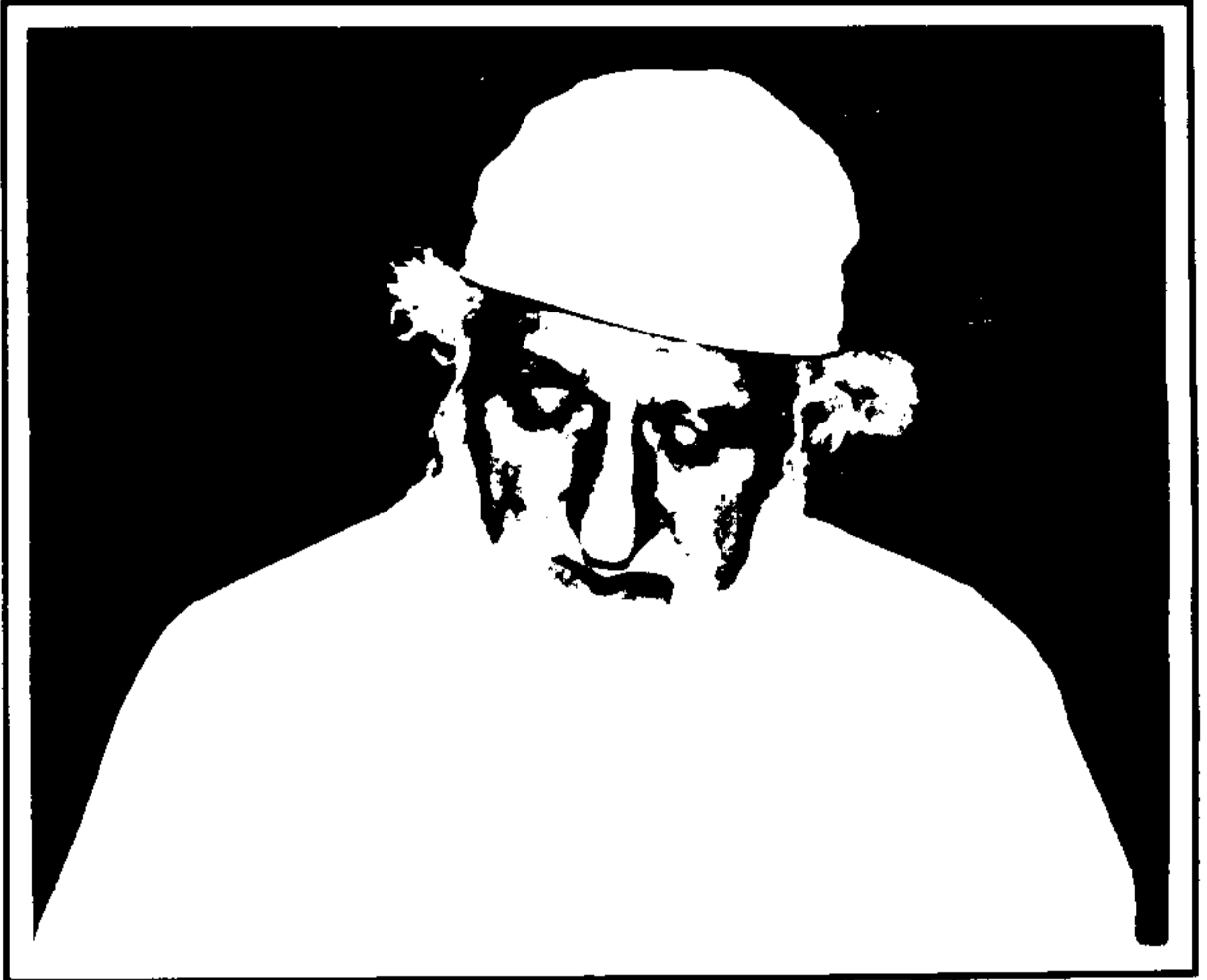
شیخ الاسلام حضرت خواجہ محمد قمر الدین سیالوی رحمۃ اللہ علیہ